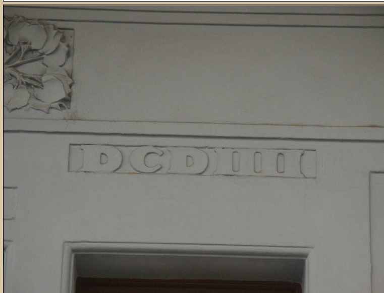
pohled na 2. díl datačního nápisu