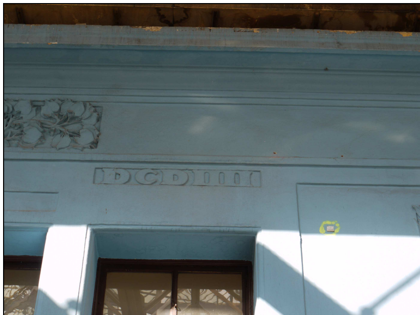
pohled na nápisy