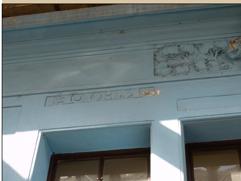
pohled na nápisy